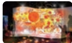
ヒカリノエノスイ -クラゲたちと彩りの秋-

夏より開催中のスペシャルイベント「ヒカリノエノスイ～美しい水族館～えのすいワンダーアクアリウム2019」の第二幕。ヒカリをテーマに美しく彩られた館内は、紅葉や月明かりなど、秋の江の島の自然やあざやかな色彩と柄を持つ海の生き物たちをイメージした「秋の彩り」を感じる幻想的な演出をお楽しみいただけます。