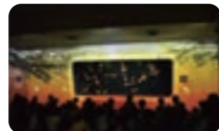
クラゲショー 海月の宇宙 ～秋～ ※写真はイメージです